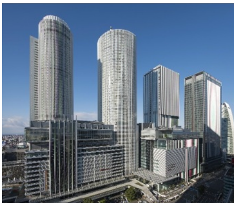
名古屋駅直上、2つのシャトルエレベーターでスムーズにアクセスできます。

実際に合格を勝ち取った現役医学部生を迎え、自身の受験体験から合格の秘訣を語ってもらいます。